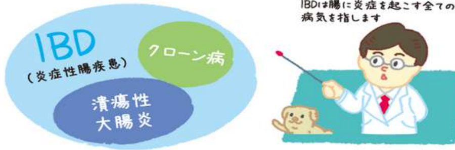
日本消化器病学会ガイドライン (jsqe.or.jp/guideline/disease/ibd.html) より抜粋

皆さんは「炎症性腸疾患（inflammatory bowel disease :IBD）」という病気があることをご存知でしょうか？IBDとは、消化管に炎症が起こり、慢性的な経過をたどる原因不明の疾患で、残念ながら現在の医学では、根治治療が確立されていません。そのため、 なるべく早く寛解（病気が落ち着いて安定した状態）導入を行い、寛解状態をできるだけ長く維持することが目標となります。 IBDには大きく分けて、 潰瘍性大腸炎とクローン病 があり、わが国ではどちらも指定難病に定められています。