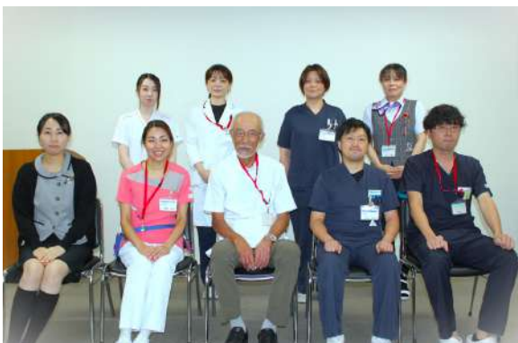
当院IBD部会スタッフ

IBDの患者さんは、適切な治療を受けて寛解を維持できていれば、疾患のない方とほぼ同様の、就労や就学といった「普通の日常生活」を送ることができます。これからもIBD患者さんが笑顔で安心して過ごせるよう、一人一人に寄り添った医療の提供を目指してまいります。