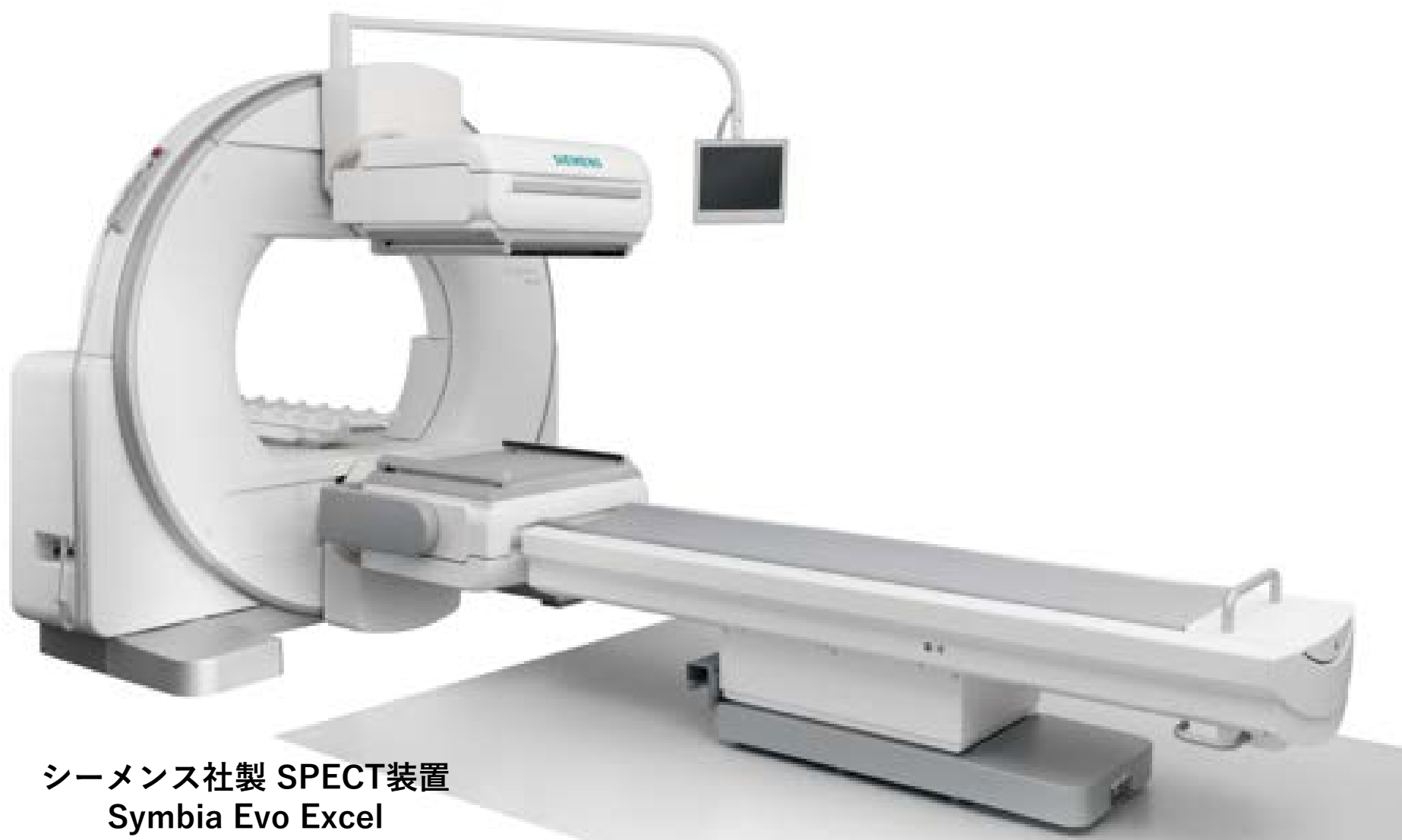
シーメンス社製 SPECT装置 Symbia Evo Excel